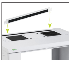
Einfache Lösung für das Kabelmanagement