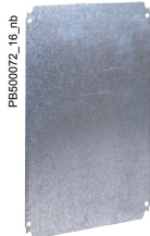
Metal mounting plate